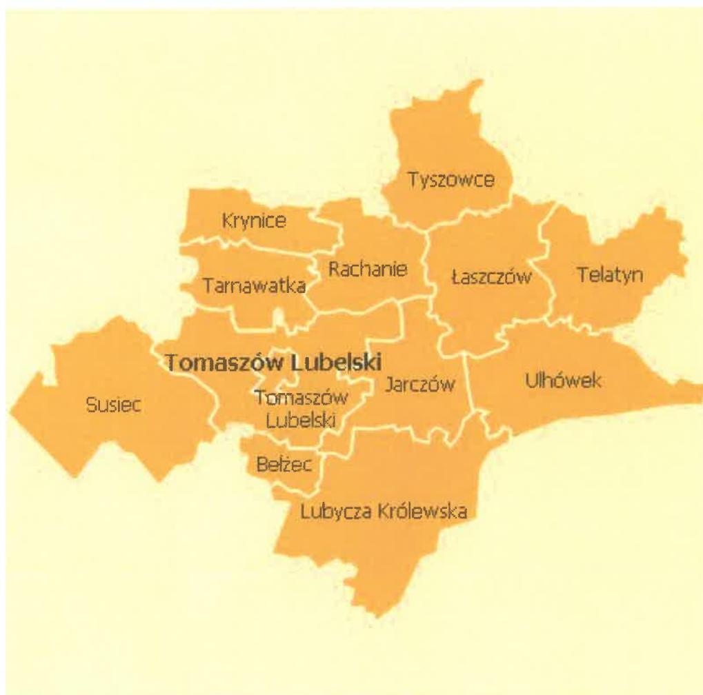
Rys. Nr 1. Mapa powiatu tomaszowskiego z podziałem na gminy.

Przez teren gminy przebiega droga krajowa nr 17 (nr 372) o znaczeniu międzynarodowym, ważny szlak komunikacyjny łączący kraje Europy Północnej ze Wschodem przez przejście graniczne Hrebenne- Rawa Ruska. Powierzchnia Gminy Lubycza Królewska wynosi 208,09 km 2 , co stanowi ok. 14% powierzchni powiatu tomaszowskiego.