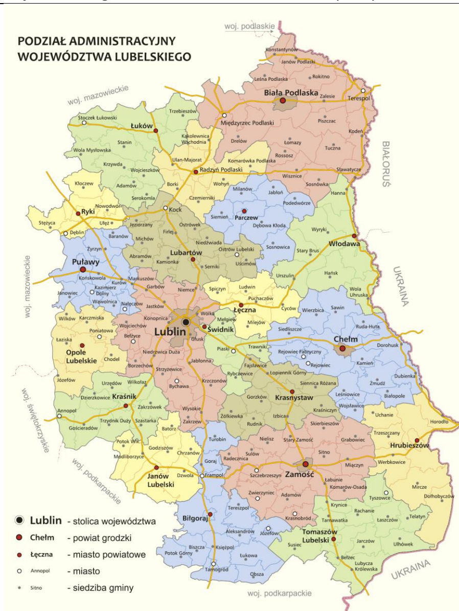
Mapa nr 1. Położenie miasta i gminy Lubycza Królewska w województwie lubelskim.