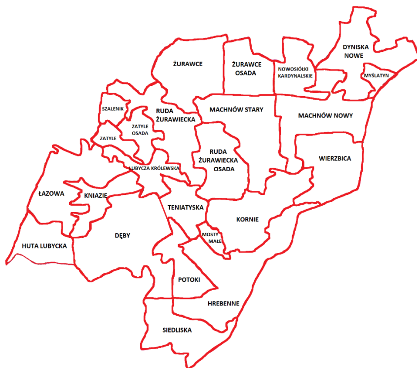
Mapa nr 3. Rozmieszczenie sołectw na terenie gminy Lubycza Królewska.