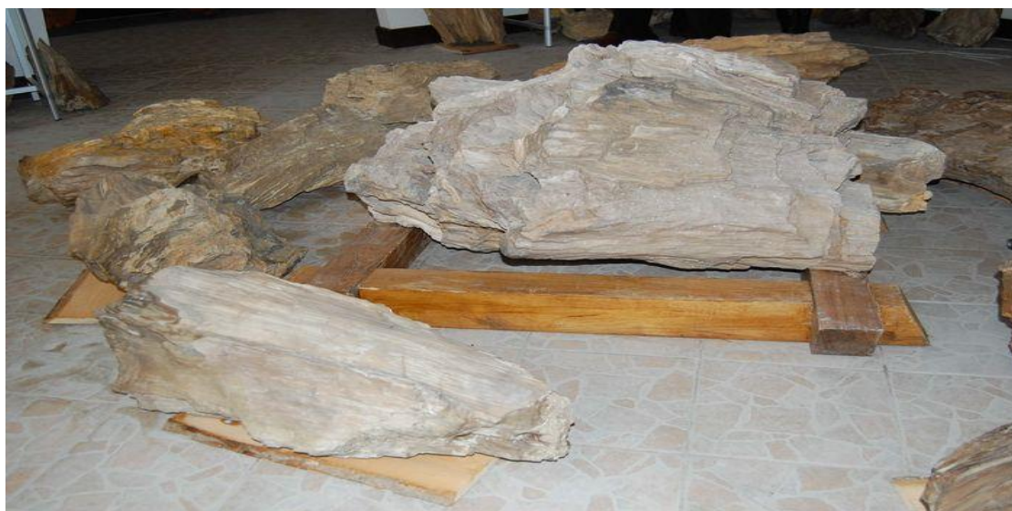
Zdjęcie nr 1. „Skamieniałe drzewa” w muzeum w Siedliskach

Objęto je ochroną w rezerwacie leśnym „Jalinka” o pow. 3,8 ha. Można je również obejrzeć w miejscowym muzeum „Skamieniałych Drzew”. Zdjęcie nr 1 przedstawia jedno z licznych „skamieniałych drzew” stanowiących eksponaty muzeum w Siedliskach.