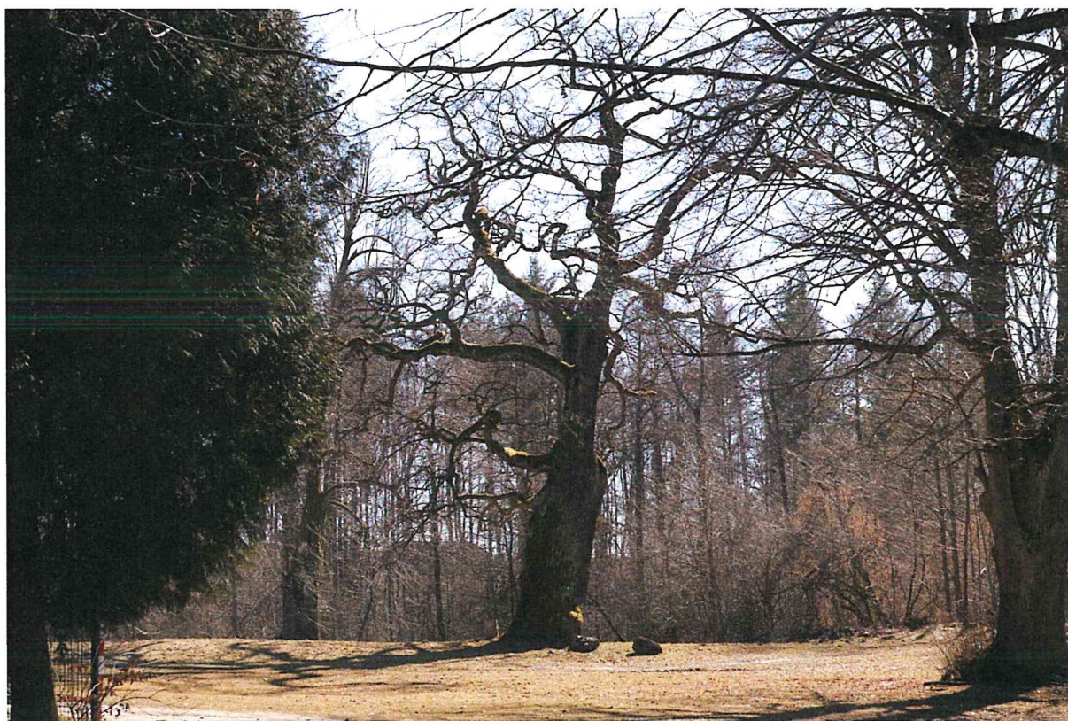
Pomnikowy Dąb w Siedliskach

Lubycza Królewska jest gminą wiejsko-miejską w powiecie tomaszowskim (woj. lubelskie) o powierzchni 208,9 km 2 , co stanowi ok. 14% powierzchni powiatu tomaszowskiego. Lubycza Królewska bezpośrednio sąsiaduje z Ukrainą. Na terenie gminy znajduje się przejście graniczne Hrebenne – Rawa Ruska. Gmina Lubycza Królewska znajduje się w obszarze Południoworoztoczańskiego Parku Narodowego oraz dwóch rezerwatów przyrody Jalina i Machnowska Góra. Na terenie gminy znajduje się dziewięć pomników przyrody oraz pięć obszarów Natura 2000 tj.: Uroczyska Roztocza Wschodniego, Żurawce, Roztocze, Dolina Sołokiji, Dolina Szyszły oraz dwa użytki ekologiczne w miejscowości Żurawce.