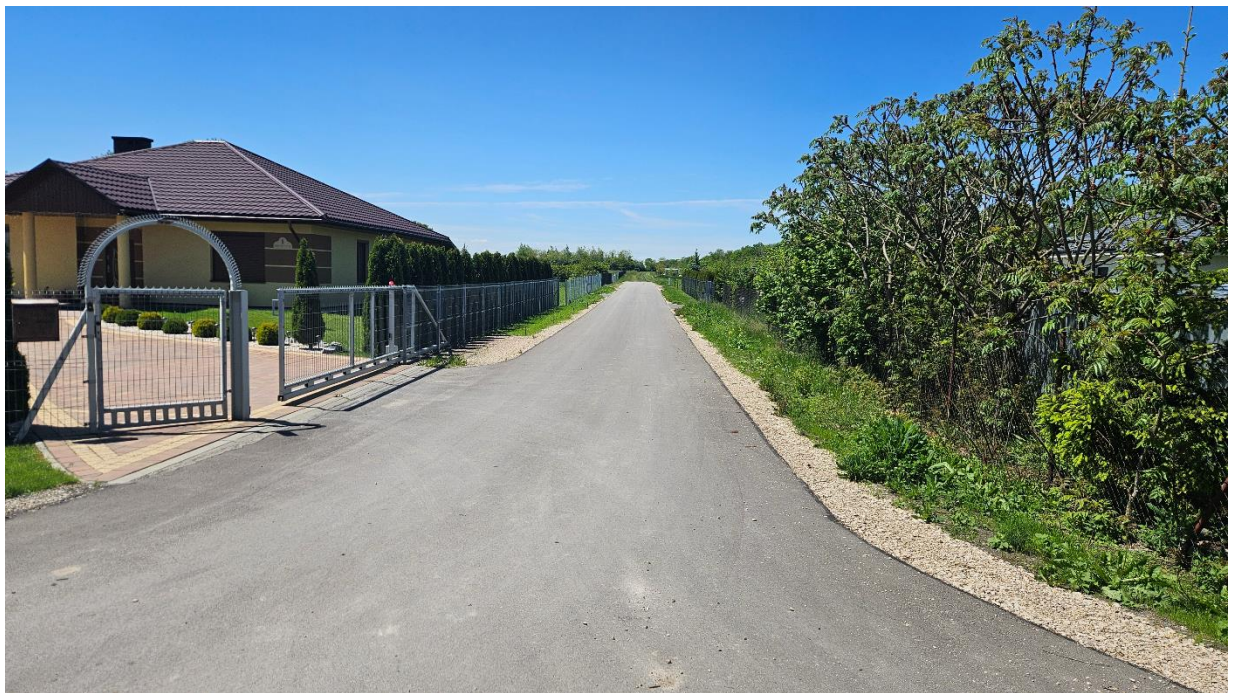
Droga wewnętrzna dz. 4/22 ul. Miodowa w Machnowie Nowym