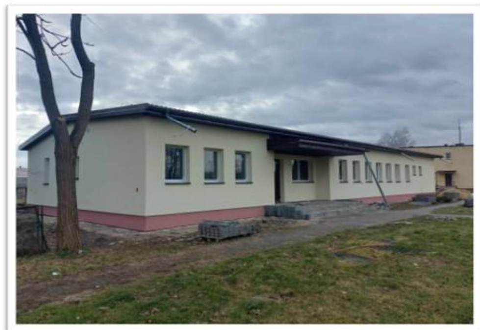
Budynek po byłym przedszkolu w Machnowie Nowym