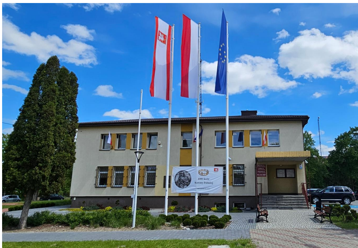
Budynek Urzędu Miejskiego w Lubyczy Królewskiej

Natomiast na dzień 31.12.2024 roku w Urzędzie Miejskim w Lubyczy Królewskiej zatrudnionych było 36 pracowników, w tym na stanowiskach kierowniczych 5, na stanowisku urzędniczym 17 osób, 5 osób na stanowisku pomoc administracyjna oraz 7 osób na stanowisku pracownik gospodarczy i 2 osoby na stanowisku konserwator.