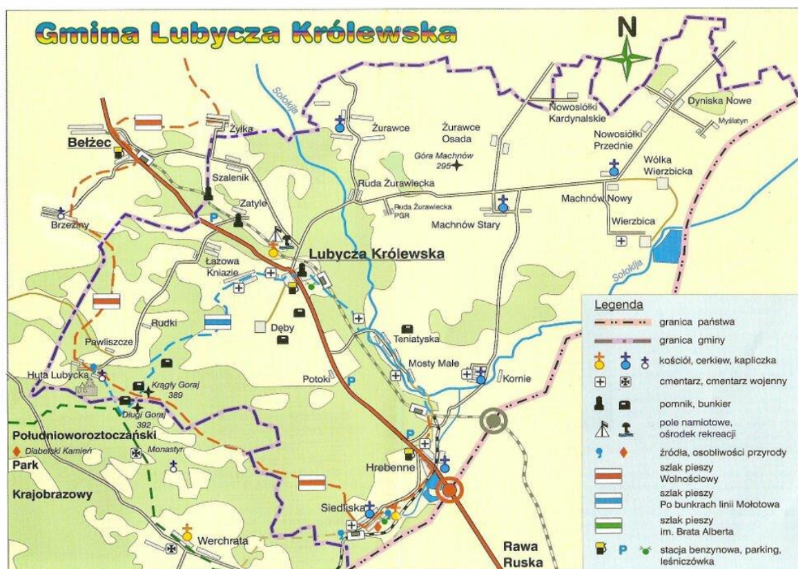
Rys. nr 2. Mapa Lubyczy Królewskiej

Dyniska Nowe, Hrebenne, Huta Lubycka, Kniazie, Kornie, Łazowa, Machnów Nowy, Machnów Stary, Mosty Małe, Myślatyn, Nowosiółki Kardynalskie, Potoki, Ruda Żurawiecka, Ruda Żurawiecka Osada, Siedliska, Szalenik, Teniatyska, Wierzbica, Zatyle, Żurawce- Osada, Żurawce, Lubycza Królewska, Lubycza Królewska Północ oraz Lubycza Królewska Południe.