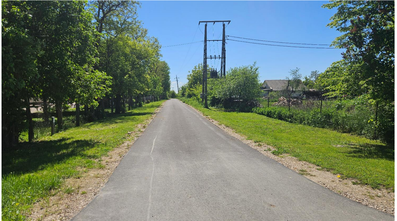
Droga wewnętrzna dz. 191 w Machnowie Nowym