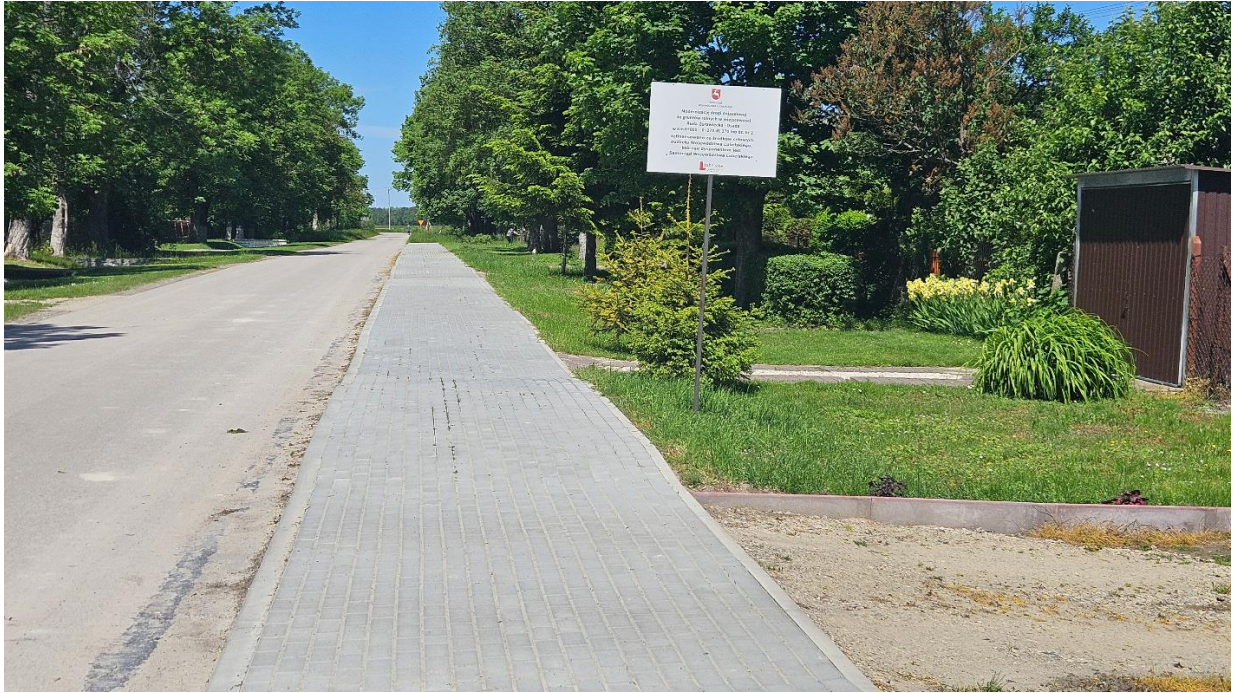
Chodnik dz. 2 w Rudzie Żurawieckiej Osada