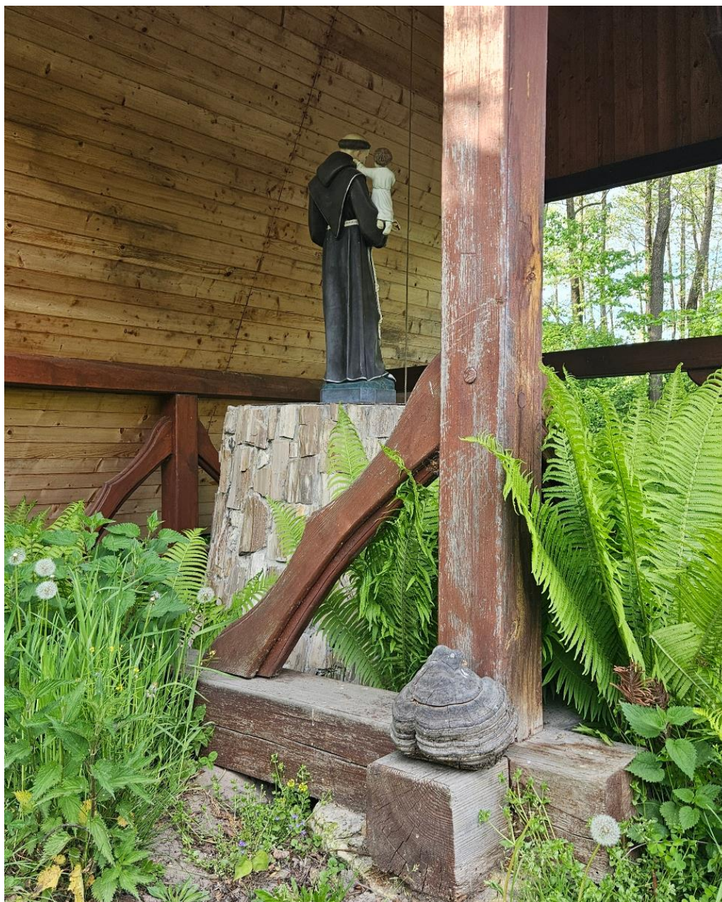
Kapliczka św. Franciszka w Siedliskach

- konferencji naukowej „Ceramika Roztocza. Z przeszłości w teraźniejszość”.