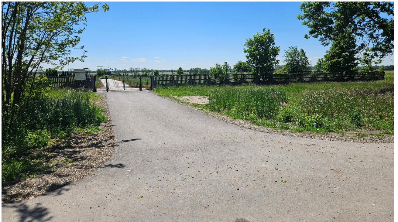
Droga do cmentarza komunalnego w Machnowie Nowym