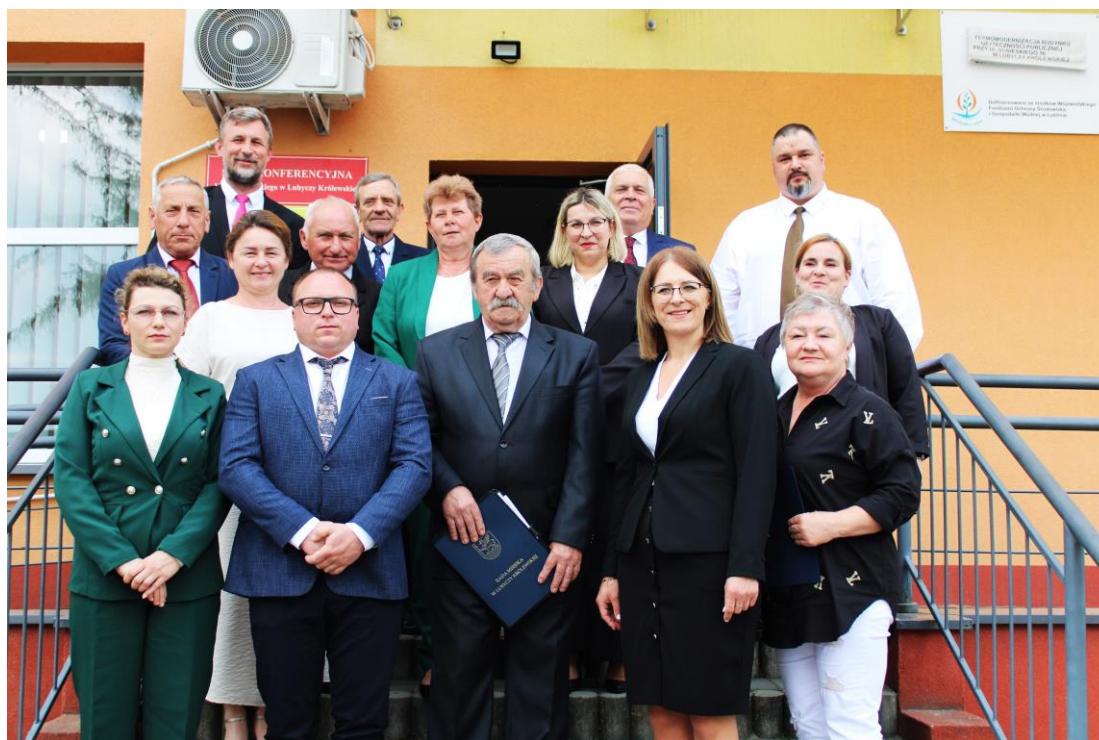
Tabela nr 3. Skład Rady Miejskiej w Lubyczy Królewskiej kadencji 2024-2029