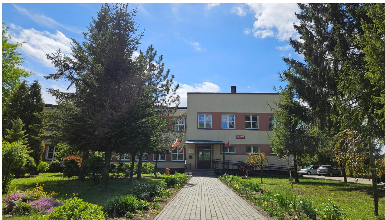
Szkoła Podstawowa im. Dzieci Zamojszczyzny w Machnowie Nowym