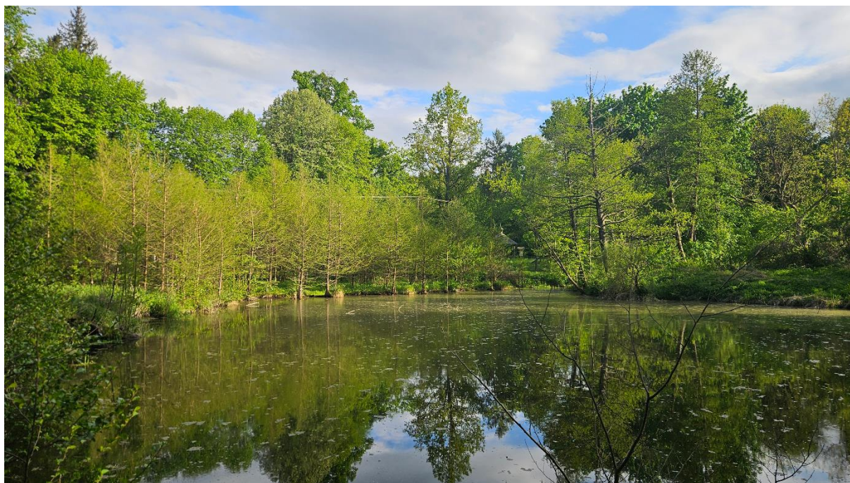
Cyprysniki Błotne w miejscowości Siedliska